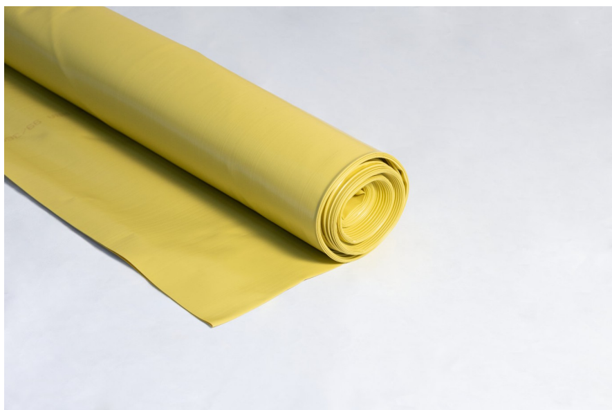
Lámina anti-radón para uso arquitectónico