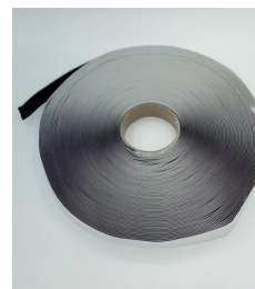
Lámina anti-radón fabricada con mezcla de polímeros de alta calidad con alta resistencia a la rotura, TOUGHSHEET es idóneo para la instalación en todo tipo de edificio, y es especialmente idóneo para superficies grandes como naves industriales, por su ancho de 4m, y sello de juntas sencilla. Cumple con la normativa DB HS6 del Código Técnico de la Edificación. Las juntas entre secciones de lámina se unen con cintas (una cinta butilica entre las láminas y una cinta americana superpuesta para cerrar el solape). Las uniones entre secciones adyacentes deben solaparse por 150 mm.