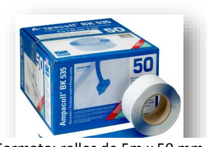
Formato: rollos de 5m x 50 mm