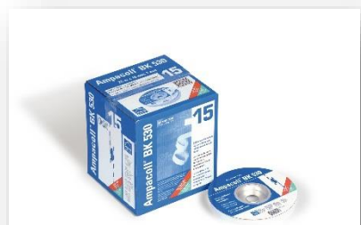
Formato: rollos de 25m x 15mm