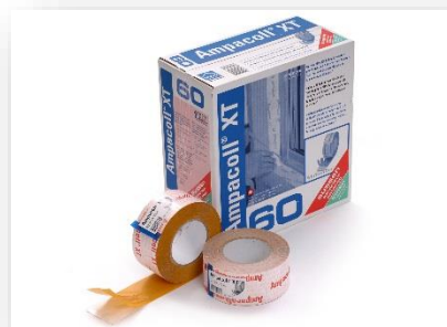
Formato: rollos de 25m x 60 mm